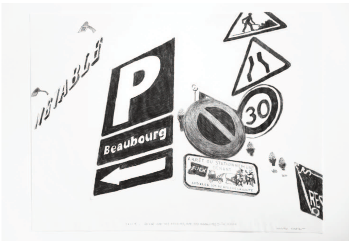
Signalétique provisoire 2006-2007