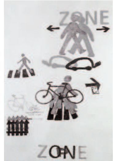
La préhistoire est toujours là, 2007, © Saif