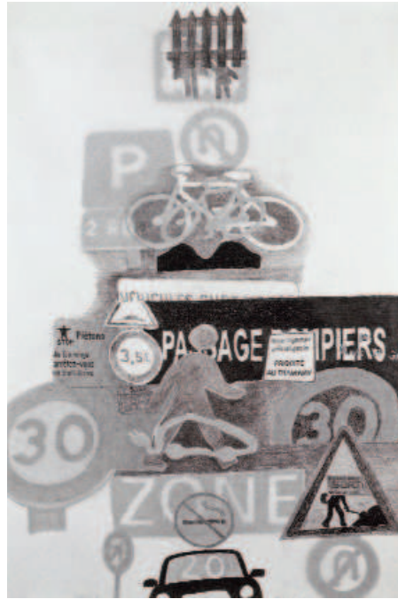
Hommage à Jacques Tati, 2007