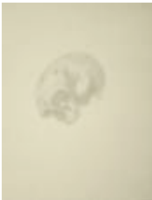
Dessin au graphite, 2000 / 2003, 94 x 63 cm ©Christine CROZAT courtesy School Gallery

Texte et visuels à télécharger sur www.schoolgallery.fr dans l'onglet PRESSE