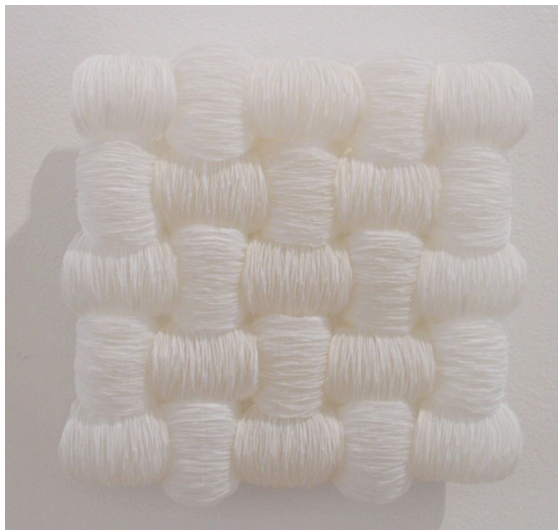
"MISCELLANNEES", 2000, papier à cigarettes - 25x25 cm ©Maryline POMIAN courtesy School Gallery