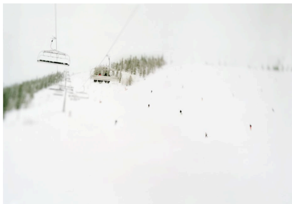
Alone with others, 2005 Photographie ©Joakim ENEROTH courtesy School Gallery