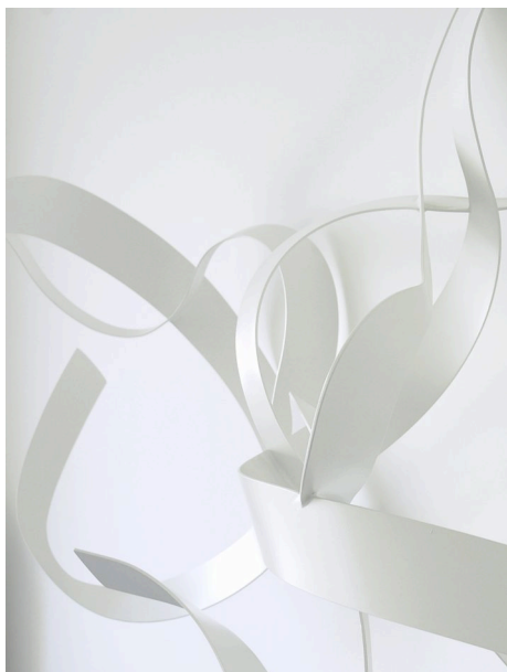
« SUPERCORDES », 2008, acier peint sur toile - ©Benoit LEMERCIER courtesy School Gallery