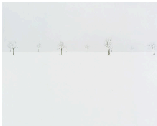
« EDGE VERSE II », 2004 / 2009 Photographie ©Nicholas HUGHES courtesy School Gallery